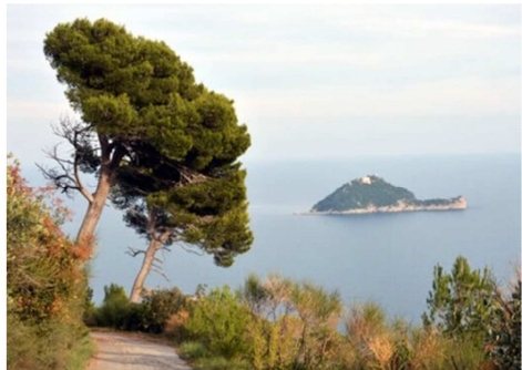
Un tratto della via Julia Augusta con l'isola Gallinara

N.B.: LA DIFFICOLTÀ, PER TUTTI I PERCORSI, È <T> L'INDICE DI FATICA VARIA DA <F1> A <F3>